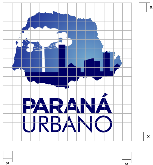
DIAGRAMA PARA DESENHO

Segue ao lado o diagrama com margens de proteção e modulação para redesenho e ampliação da logomarca.