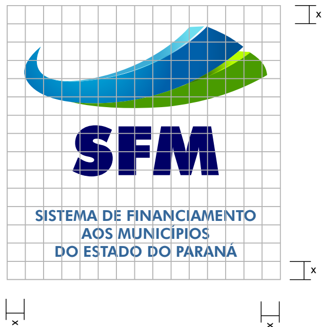
DIAGRAMA PARA DESENHO

Segue ao lado o diagrama com margens de proteção e modulação para redesenho e ampliação da logomarca.